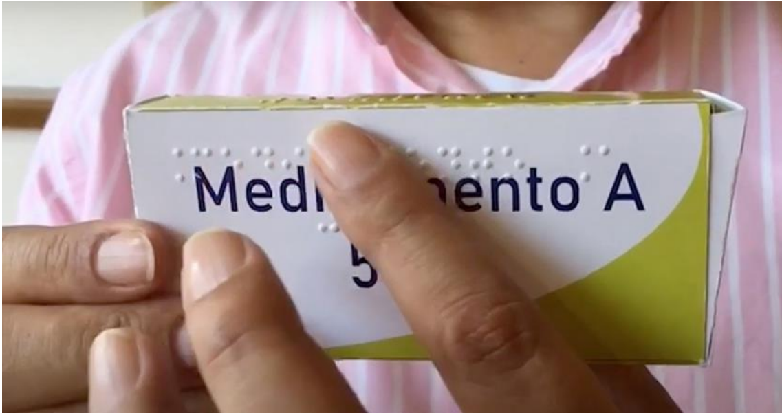
Empaquetado en sistema braille de alimentos procesados de primera necesidad y de medicinas