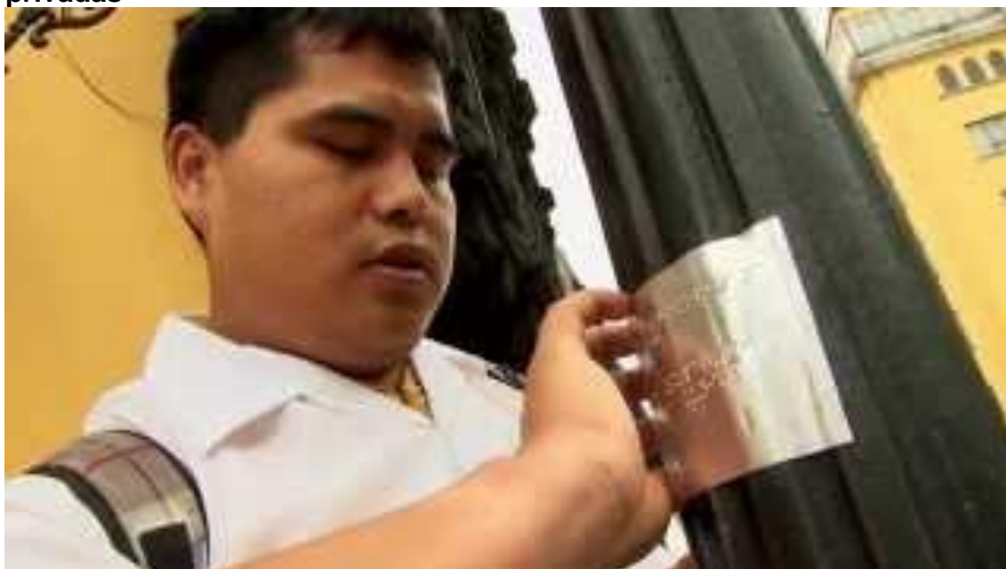
Modificación de los artículos 21 y 33 de la Ley 29973, Ley General de la Persona con Discapacidad