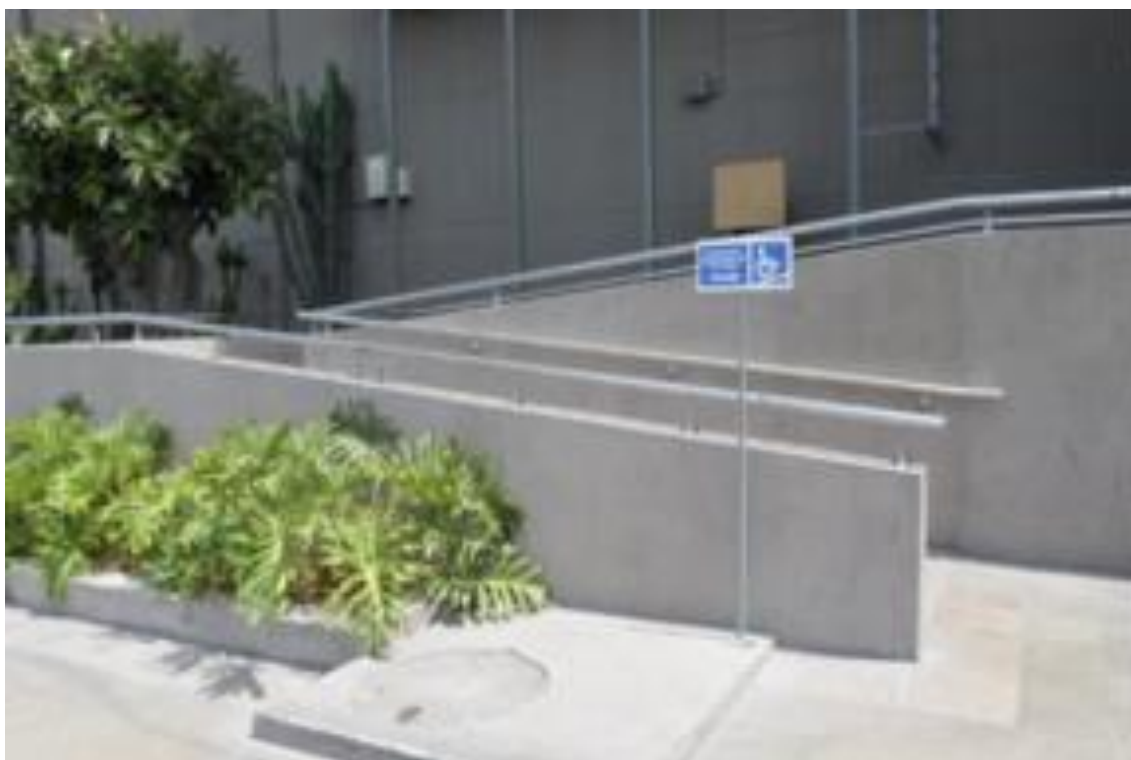
Placas braille de orientación y señalización en edificaciones públicas y privadas